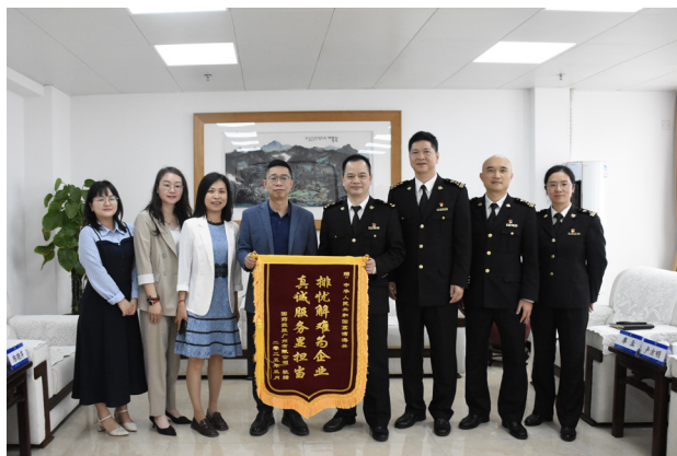
■ 文 / 国控广州物流中心 李木惠

国控广州将以更高标准积极配合海关监管工作，以“通关+仓储+配送”一体化创新，共同推动药械监管工作高质量发展，努力成为“关企合作”典范，为广州市打造全国产业生态最好、政务服务最优、综合成本最低的营商环境高地持续贡献力量。